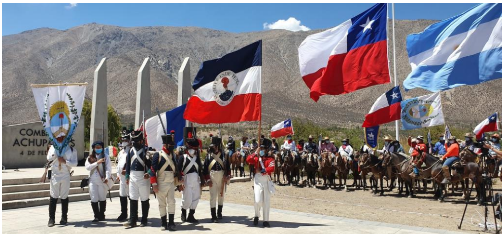
Imagen 7: Conmemoración de Achupallas, 2022.

San Martín reconoce inmediatamente el valor de la acción escribiendo en una carta del 8 de febrero, “apenas el sargento-mayor de ingenieros D. Antonio Arcos, comandante de avanzada, se presentó con la partida del 4 corriente, en las gargantas de Achupallas, cuando fue puesto el enemigo en fuga vergonzosa, como anunció el parte del mismo Arcos, que tengo el honor de acompañar a V. E., encomiando el mérito de este oficial” 4 Una de las primeras promociones que recibe Arcos es su nombramiento como edecán del mismo San Martín, posición que le permite reconocer el terreno antes de la batalla de Chacabuco durante la cual se distingue el 12 de febrero siguiente. En esta ocasión, el ejército español es completamente derrotado lo que permite pensar en una pronta liberación e independencia de Chile.