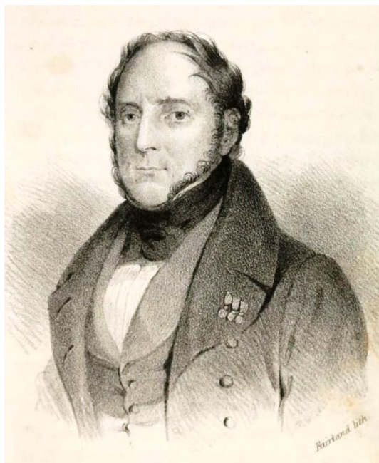
Imagen 1: el General Benjamín Viel Gomets.

Maipú (1818), ayudando entre otras cosas al coronel Bueras después de su grave herida, y continúa sirviendo con éxito para eliminar la presencia española, militar, real y colonial, en las regiones del sur, especialmente en el archipiélago de Chiloé hasta 1826. Su carrera se ve momentáneamente interrumpida durante las guerras civiles de 1830-1831 que enfrentan a conservadores y liberales. Formando parte de estos últimos, pasa del estado militar al periodismo en el periódico "El Defensor de los Militares Denominados Constitucionalistas", en el cual publica varios artículos muy críticos sobre los proyectos conservadores, promoviendo la idea republicana y la transformación social. La derrota de su corriente política lo obliga a exiliarse en Perú hasta 1839.