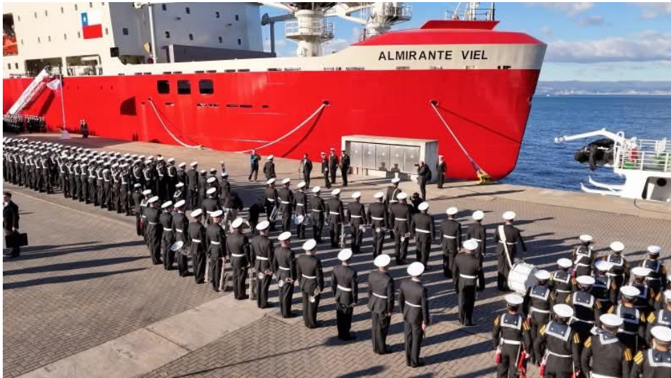
Imagen 3: Rompehielos 'Almirante Viel', de la Armada de Chile.