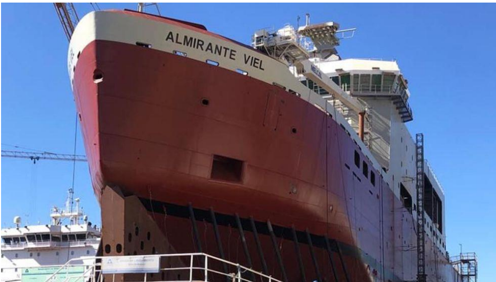
Imagen 4: El rompehielos 'Almirante Viel'.

Gracias a la existencia de este buque, los Viel se encuentran una vez más en el corazón de la vida civil y militar del país y constituyen la prueba de la persistencia de la influencia napoleónica hasta nuestros días. Una persistencia defendida, reivindicada y concretamente afirmada por la Fundación de los Napoleónicos de Chile.