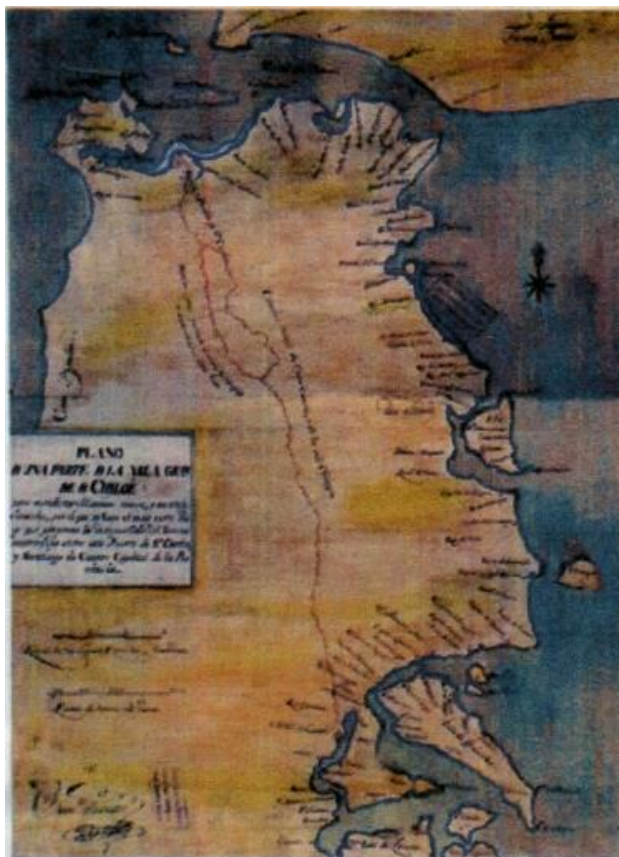
Imagen 2: copia del mapa de Caicumeo existente en la Sala José Toribio Medina (Biblioteca Nacional de Chile), Santiago.

El propio Medina (1923) dice "El original se encuentra en el AGI, Madrid" pero no explica cómo se obtuvo una copia para incluirla en su mapoteca de la Sala Americana. Por otra parte, el copista distaba mucho de poseer las capacidades técnicas y valor estético de Moraleda, la coloración que aplica es ciertamente inferior. Aunque mantiene fidelidad con el dibujo original, cambia algunas letras en el título de la cartela, y traslada la firma de Hurtado desde el centro hacia la izquierda, bajo las escalas gráficas. Se reproduce a continuación, en la imagen 2.