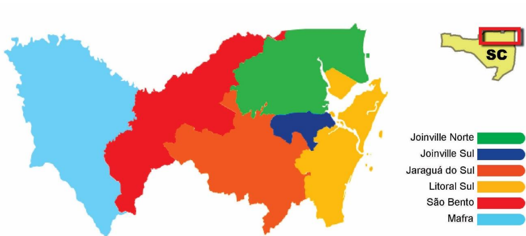
Figura 2. Mapa Diocese de Joinville.

No curto espaço de um mez o Exmo. E Revmo. Snr. Bispo Diocesano, acompanhado de vários sacerdotes visitou as cidades que vão ser sedes de novos Bispados [...] Organizou S. Excia. em todas ellas a comissão encarregada do patrimônio, alcançando ao mesmo tempo a promessa de que tudo se faria para a mais breve realização da vontade do Santo Padre Pio X, quanto às Novas Dioceses. (sic)