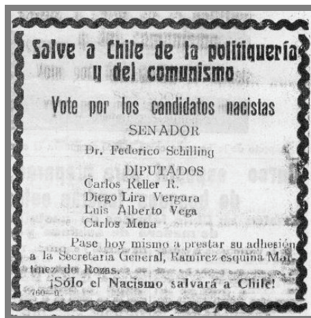
Imagen n.º 4. Propaganda política en el diario “La Prensa” de Osorno que llamaba a votar por los candidatos del MNS.

El segundo elemento claramente apreciable de la propaganda nacistá en el diario local estuvo representado por el sentido contestatario de ésta, siendo frecuente hallar en su discurso expresiones de ataque y defensa, la mayoría de las cuales tenían como blanco el Frente Popular. Los mismos integrantes del MNS reconocían que se habían servido permanentemente de su tribuna en “La Prensa” con tales fines: “Desde las columnas de la “Página Nacista” de este diario hemos venido sosteniendo incesantemente que el verdadero peligro para nuestra patria está actualmente en el Frente Popular, por su combinación política de carácter netamente comunista” . 52 El MNS en este medio sostenía que la izquierda chilena era parte de una confabulación internacional, la cual había actuado en Rusia y causaba por aquellos días los males de la revolución en España. Los nacistas difundían en el diario de Osorno informaciones como la citada a continuación, la cual refleja claramente su posición: “En la bolsa negra de Santiago, según informa la prensa, se han estado vendiendo numerosas letras y cheques procedentes de Montevideo, que estarían destinados a costear los gastos electorales de los candidatos bolcheviques” . 53 La nota sentenciaba finalmente que: “Es necesario pues, unirse en un frente anti-comunista para defenderse de la hidra roja y evitar que este país pase a ser una factoría de Moscú” . 54