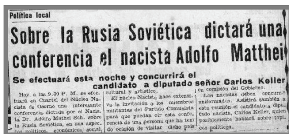
Imagen n.º 3. El diario “La Prensa” de Osorno informa sobre próxima conferencia del nacista Adolfo Matthei en la ciudad.